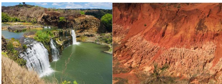
Photo de gauche : Paysage Bassin Versant Irodo : Cascade sur le lit de la rivière d'Irodo, dans le Fokontany d'Ambery - Commune rurale d'Anivorano-Nord, Région DIANA.

Le projet fait partie de l'initiative spéciale SEWOH "UN SEUL MONDE sans faim" du BMZ. Grâce aux projets de cette initiative spéciale, le BMZ contribue à la réduction de l'extrême pauvreté et la faim par la mise en place de plusieurs projets globaux touchant différents secteurs, dans le monde. L'accent est mis sur les thèmes suivants : sécurité alimentaire, résilience et sécurité alimentaire en cas de crise et de conflit, innovation dans le secteur agricole et alimentaire, mutation structurelle écologique et sociale en milieu rural, exploitation durable des ressources naturelles en milieu rural, garantie des droits fonciers. Cela intègre la restauration des paysages et des forêts et la bonne gouvernance dans le secteur forestier.