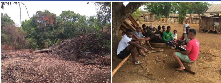
Photo de droite : Discussion avec la communauté locale à Matsaboribe - Commune rurale d'Anivorano-Nord, Région DIANA © F4F GIZ.

manque des actions concrètes pour mettre en œuvre et coordonner les nombreuses contributions des différents acteurs au niveau du paysage. Le projet F4F contribue directement à la réalisation de l'auto-engagement de Madagascar dans le cadre de l'AFR100. Le projet combine des approches paysagères et forestières et met ainsi l'accent sur le rôle particulier de la forêt dans le développement rural dans le contexte de la sécurité alimentaire.